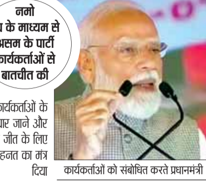
नमो एप के माध्यम से असम के पार्टी कार्यकर्ताओं से बातचीत की

पीएम नरेंद्र मोदी ने सोमवार को 'मेरा बूथ सबसे मजबूत संवाद' नामक जनसंपर्क कार्यक्रम के तहत नमो एप के माध्यम से असम के पार्टी कार्यकर्ताओं से बातचीत की। इस दौरान प्रधानमंत्री ने कांग्रेस सरकार को घेरा