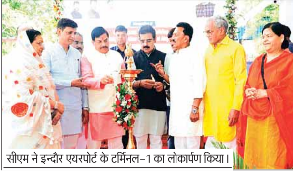
सीएम ने इन्दौर एयरपोर्ट के टर्मिनल-1 का लोकार्पण किया।

सुविधाओं को अमेरिका क्वालिटी कॉन्सिल ने क्वालिटी सर्टिफिकेट से सम्मानित किया है। मुख्यमंत्री ने कॉन्सिल की ओर से दिया गया क्वालिटी सर्टिफिकेट ऑफ रजिस्ट्रेशन इन्दौर एयरपोर्ट के पदाधिकारियों को सौंपकर बधाई दी।