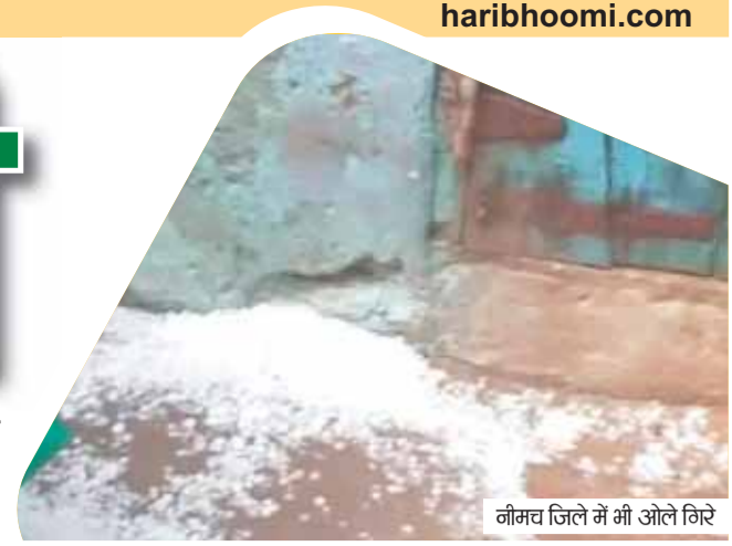
नीमच जिले में भी ओले गिरे