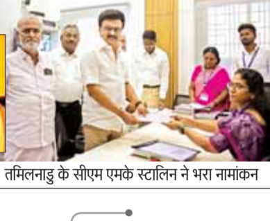
तमिलनाडु के सीएम एमके स्टालिन ने भरा नामांकन

बंगाल विधानसभा चुनाव को लेकर राजनीतिक गतिविधियां अपने चरम पर हैं। राज्य में विपक्ष के नेता और भाजपा के कद्दावर नेता सुवेंदु अधिकारी ने सोमवार को अपना नामांकन दाखिल कर दिया। इस मौके पर उनके साथ केंद्रीय मंत्री धर्मेंद्र प्रधान भी मौजूद रहे। वे इस बार पश्चिम बंगाल की दो प्रमुख विधानसभा सीटों भवानीपुर और नंदीग्राम से चुनाव लड़ रहे हैं। यह ममता का गढ़ है।