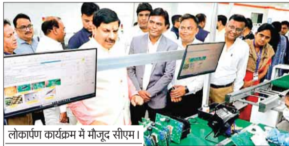
लोकार्पण कार्यक्रम में मौजूद सीएम।