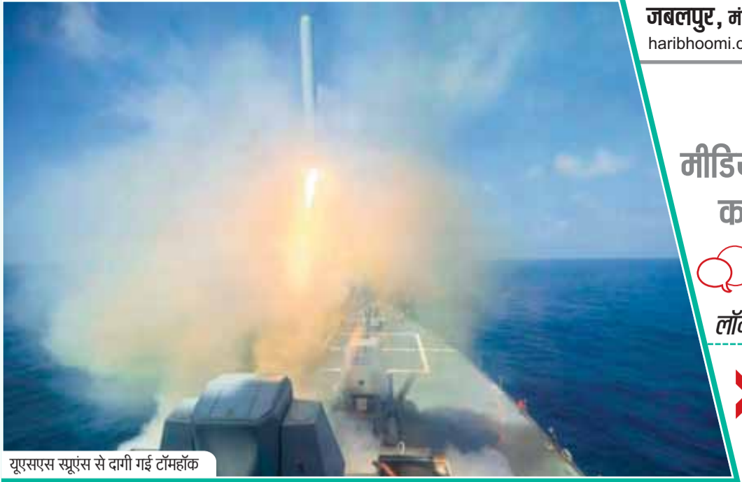
यूएसएस स्फूर्ण से दागी गई टॉमहॉक