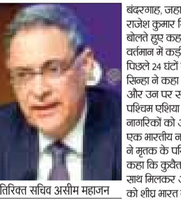
अतिरिक्त सचिव असीम महाजन