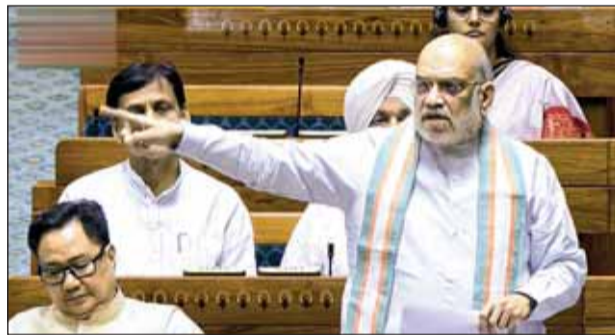
केंद्रीय गृह मंत्री अमित शाह लोकसभा में बोलते हुए

►► बस्तर में हर गांव में राशन की दुकान खोलने की मुहिम चली, हर गांव में विकास पहुंचा